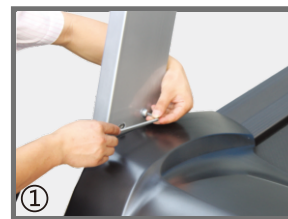
① 用内六角扳手将立柱下方固定螺丝上紧。