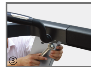
③ 用固定扳手将立柱上方固定螺丝上紧。