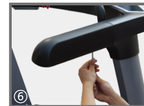
⑥ 用六角扳手将扶手泡棉固定