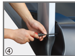
④ 用螺丝刀将马达盖固定