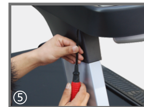
⑤ 用螺丝刀将立柱上护套固定