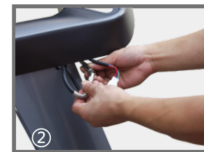
② 放上电子表后，将各连接线插上。