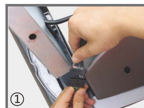
① 插入方管立柱，将各连接线接头插好（注意方向）。