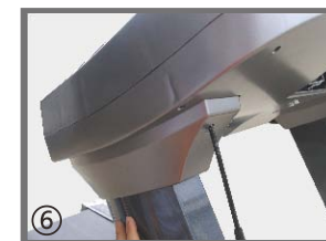
⑥ 用螺丝刀将立柱上护套固定。