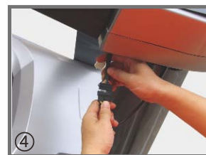
④ 放上电子表后，将各连接线插好（注意方向）。