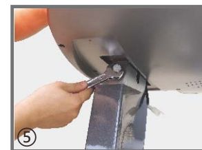
⑤ 用固定扳手将电子表与立柱上方螺丝上紧。