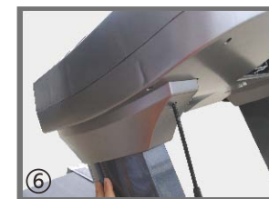
⑥ 用螺丝刀将立柱上护套固定。