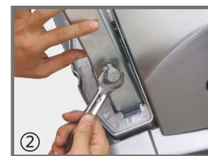
② 用固定扳手将立柱上方固定螺丝上紧。（4只）