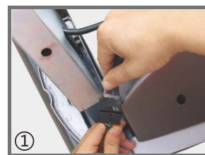
① 插入方管立柱，将各连接线接头插好（注意方向）。